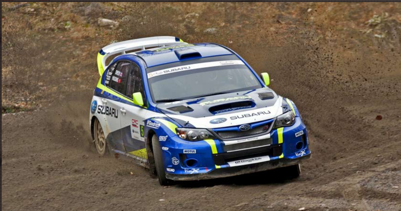
Higgins - Drew / Team Subaru Rally USA / Subaru Impreza