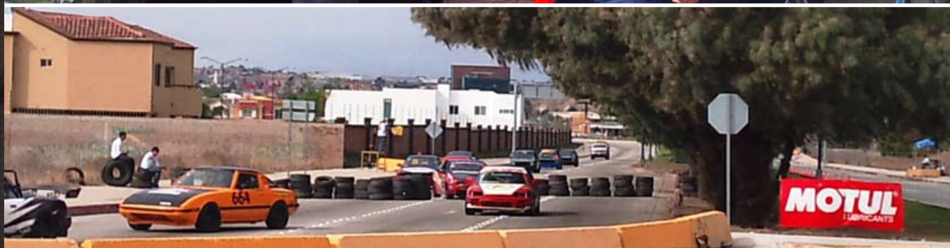
Mexican Street racing / Tijuana Grand-Prix